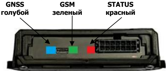
Рисунок 1. Назначение индикаторов

На плате Терминала расположены три видимых снаружи корпуса светодиодных индикатора для контроля работы Терминала . Назначение индикаторов изображено на Рисунке 1 и описано в Таблице 2 .